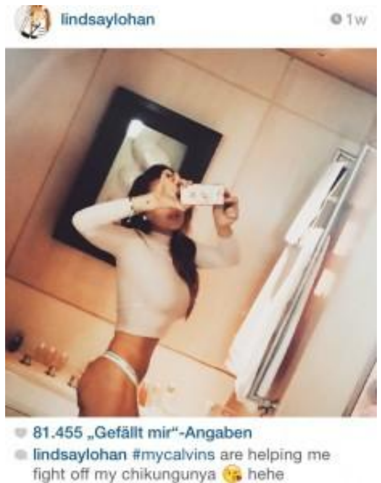
Bild: Lindsay Lohan beherrscht perfekt die Selbstinszenierung auf der digitalen Bühne von Instagram.

Das verändert das Employer Branding und selbstverständlich auch den Führungsstil. Die Kommunikationsebenen werden nahezu frei sein von der Hierarchie.